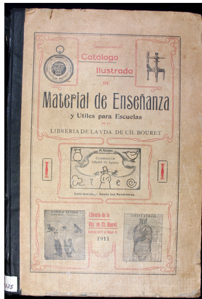
Ilustración 3 Cubierta del Catálogo ilustrado de Material de Enseñanza y Útiles para Escuelas. México, Viuda de Ch. Bouret, 1911 (Ref. 3321)

datación para las litografías toda vez que es la única evidencia documental de al menos una colección numerosa de litografías. Desafortunadamente en dicho documento no se indicó la cantidad de estampas de que estaban compuestos estos cuadernos.