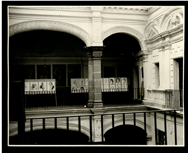
Ilustración 6. Casa de las Bóvedas.

de los cinco órdenes [Material gráfico] / según J.B. de Viñola ... ; obra dividida en setenta y dos láminas que comprenden los cinco órdenes ... ; compuesto, dibujado y ordenado por J.A. Léveil ... ; y grabado sobre acero por Hibon. París : Garnier Hermanos, librerros-editores, 1899 70 .