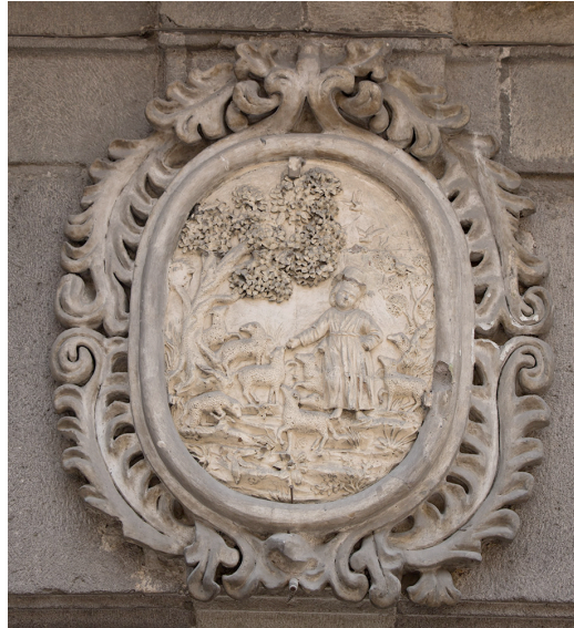
Ilustración 1 Sello de Armas de la Antigua Junta de Caridad. Casa de las Bóvedas.