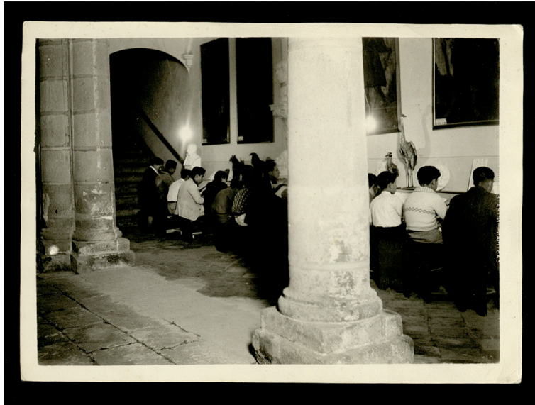
Ilustración 5. Casa de las Bóvedas. Colección de fotografías del fondo Academia de Bellas Artes de Puebla

Pero la formación no solo se basaba en la copia de modelos, la cual constituían la parte denominada ‘Principios’, el sistema educativo de las Academias de Arte incluía dibujo teniendo como modelos los yesos. Este nivel exigía del alumno una mayor soltura y creatividad. En la Memoria instructiva y documentada que el Jefe del Departamento Ejecutivo del Estado presenta al XVIII Congreso Constitucional de 1905 indica en el ‘Informe del Director de la Academia de Bellas Artes’ se menciona justamente este tipo de adquisiciones: